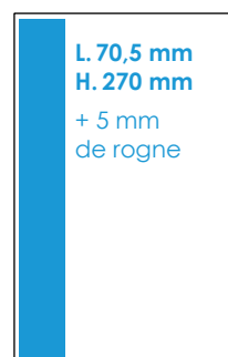
1/3 Page hauteur