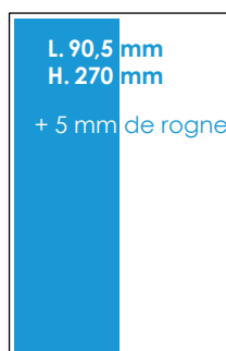
1/2 Page hauteur