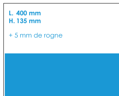
Double 1/2 Page horizontale