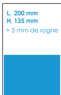
1/2 Page largeur