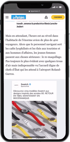
SOCIAL POST CLASSIQUE