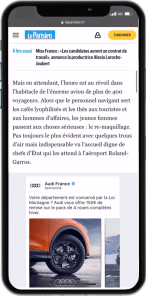
SOCIAL POST CAROUSEL