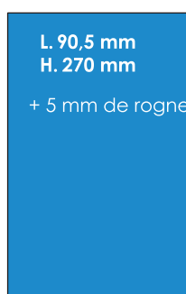
1/2 Page hauteur