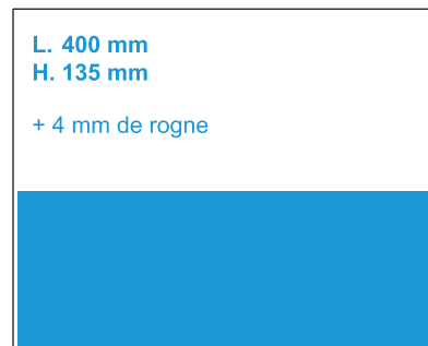
Double 1/2 Page horizontale