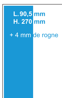
1/2 Page hauteur