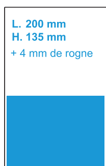
1/2 Page largeur