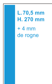
1/3 Page hauteur