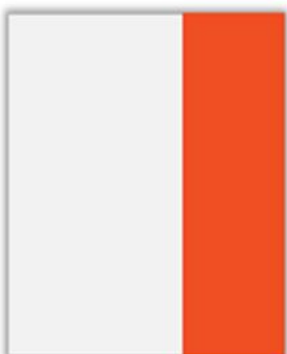
1/3 Page Hauteur PP H 286 x L 76