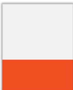
1/3 Page Largeur PP H 95 x L 230