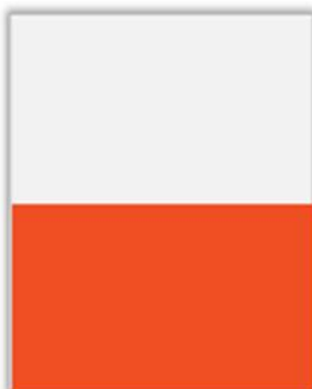
1/2 Page Largeur PP H 143 x L 230