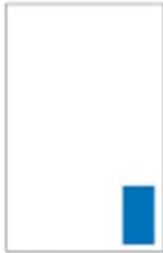
Premium H 115 x L 68