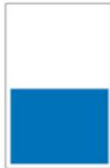
1/2 Page largeur H 215 x L 287