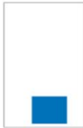
Medium H 105 x L 138