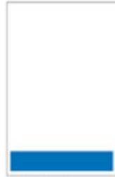
Médium bandeau H 55 x L 287