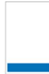
1/6 Page Bandeau H 55 x L 287