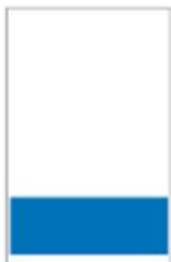
1/4 Page bandeau H 106 x L 287