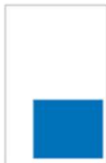
1/4 Page Carré H 162 x L 190