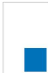
1/6 Page H 145 x L 141