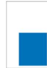
1/3 Page Carré H 215 x L 190