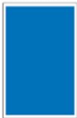
Page H 430 x L 287