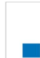
1/6 Page Carré H 109 x L 141