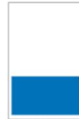
1/3 Page Bandeau H 145 x L 287