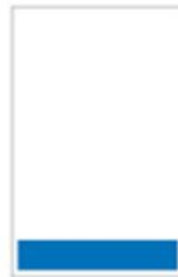
Médium bandeau H 55 x L 287