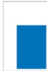
News H 272 x L 190